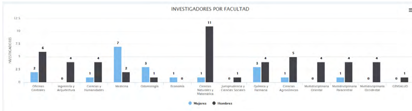
Figura 3. Indicadores de investigadores e investigadoras por género y Facultad de la convocatoria 2017.