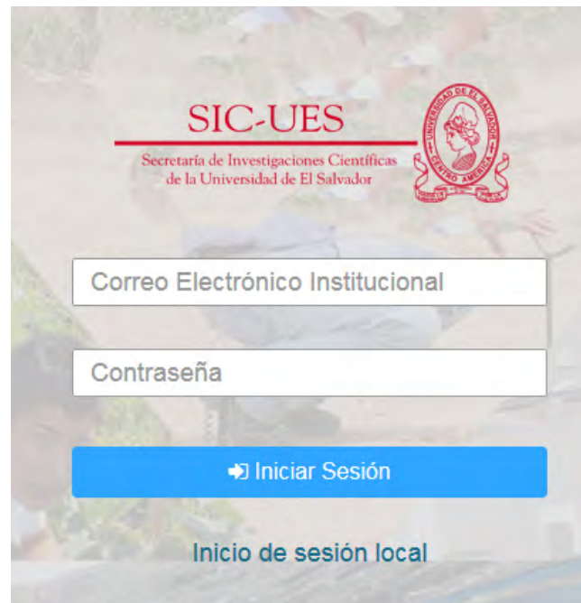
Figura 1. Ventana de acceso al SIPC-UES.

La dirección de acceso al SIPC-UES es https://sipc.sic.ues.edu.sv y se puede registrar utilizando las credenciales del correo electrónico institucional.