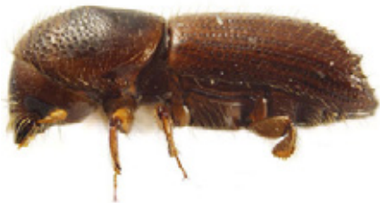
Figura 9. Barrenador Xyleborus ferrugineus (F., 1801).

Nombre científico: Xyleborus ferrugineus (F., 1801)