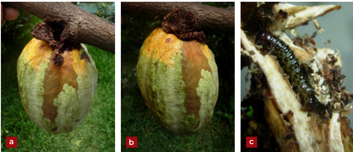
Figura 11. Barrenador del cacao Stenoma sp.: a, b) Frutos de cacao perforados por la larva, mostrando excrementos mezclados con la seda que produce en el área atacada; c) larva perforando rama bifurcada de cacao.

Entre los enemigos naturales se encuentran, parasitoides: Actia panamensis Curran (Diptera: Tachinidae), Conura sp. (Hymenoptera: Chalcididae); Depredadores: Dolichoderus bispinosus (Olivier) (Hymenoptera: Formicidae) (Gielis 2006; Matthews & Miller 2010).