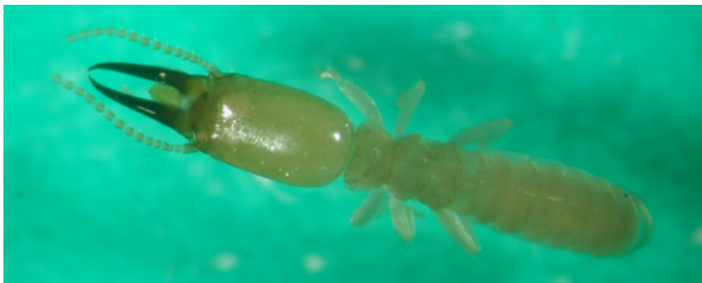
Figura 7. Casta de soldado de termita Heterotermes convexinotatus (Snyder, 1924).

Como enemigos naturales, las larvas por ser de hábitat subterráneo, son controladas fácilmente por patógenos. Los hongos ejercen un buen control y existen reportes que demuestran que cerca del 80% de las enfermedades de los insectos son causadas por hongos. Uno de los hongos más utilizados es Metarhizium anisopliae , que es fácilmente identificable por su coloración blanca, la cual posteriormente se vuelve verde olivo; pero a nivel de campo se han encontrado otros hongos como Cordyceps sp. , que atacan larvas de gallina ciega. También existen protozoarios, virus, bacterias y nematodos que causan mortalidad al insecto. Los adultos son controlados por moscas del género Pyrgota sp. , las cuales parasitan a los escarabajos o chicotes en pleno vuelo, colocando la mosca sus huevos en el interior de las alas de los escarabajos. Además, existen ectoparásitoides de larvas de gallina ciega, como, por ejemplo: Campsomeris dorsata (Hymenoptera: Scollidae) y Tiphia sp. (Hymenoptera: Tiphidae). También son importantes los sapos y lagartijas como depredadores. Bacterias entomopatógenas: Bacillus popilliae y Bacillus thuringiensis (Trabanino 1998; Sermeño et al. 2005).