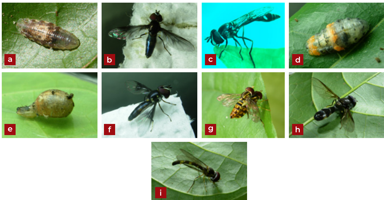
Figura 5. Diptera de la familia Syrphidae depredadores de Toxoptera aurantii (Boyer de Foscolombe, 1841): a, b) Ocyptamnus cf. antiphates (Walker, 1849); c) Pseudodoros clavatus ; d, e, f) Ocyptamnus gastroctactus (Wiedemann, 1830); g) Toxomerus cf. pictus ; h) Orphnabaccha sp. (grupo coerulea ); i) Ocyptamnus sp. (grupo lepidus ).