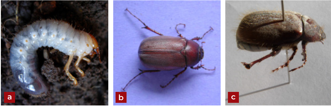
Figura 6. Insectos rizófagos en cacao: a) Larva de Phyllophaga sp.; b) Phyllophaga elenans Saylor; c) Phyllophaga menetriesi (Blanchard).