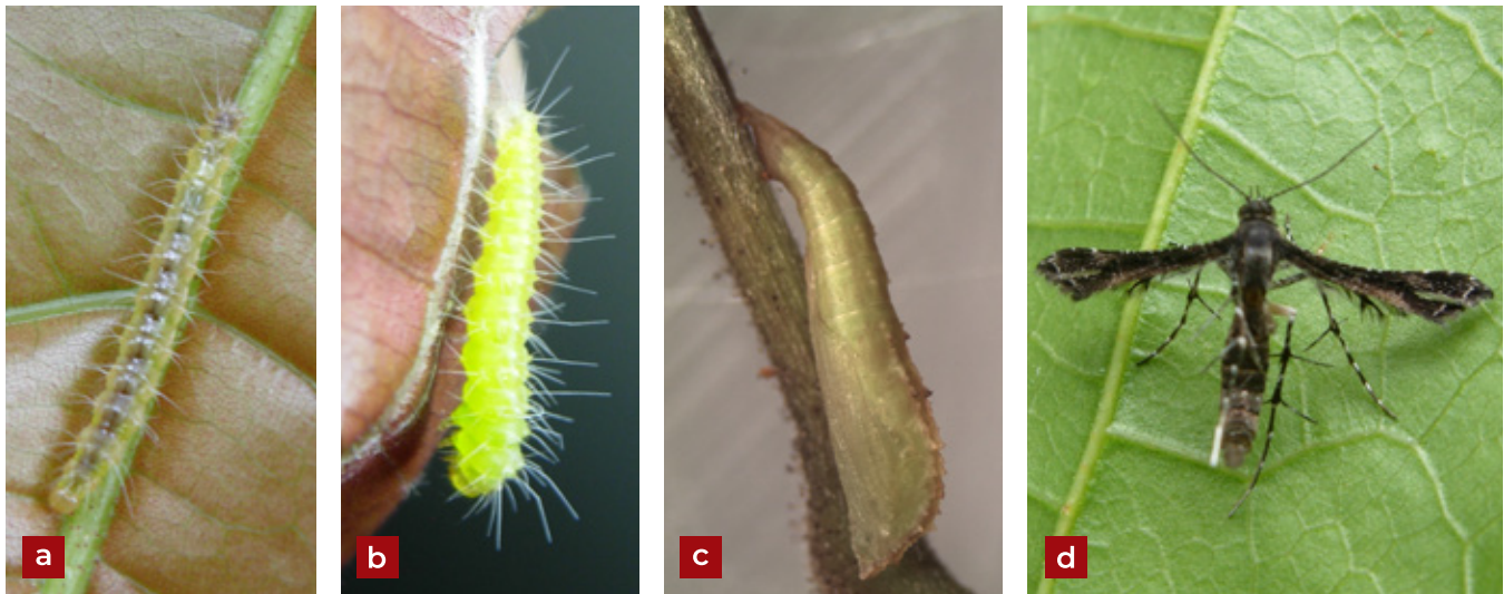
Figura 10. Polilla del cacao Michaelophorus nubilus (Felder & Rogenhofer, 1875): a) larva; b) prepupa; c) pupa; d) adulto.

La forma del cuerpo de los adultos de Xyleborus ferrugineus (F.), es cilíndrica y se presenta oblicuamente truncado en su extremo posterior. La cabeza está considerablemente retraída en el protórax, de modo que no se observa desde el dorso. Los ojos son muy grandes, con facetas toscas y el margen anterior emarginado. El pronoto tiene las partes antero-laterales provistas con depresiones amplias, poco profundas, que le otorgan una textura semi-rugosa (Morón y Terrón, 1988).