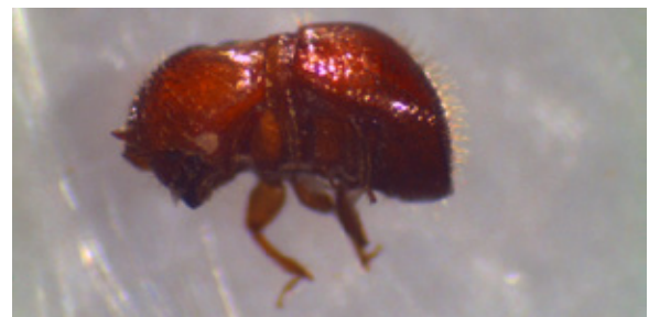
Figura 8. Barrenador de las ramas del cacao Xylosandrus morigerus (Blandford, 1897).

Nombre científico: Xylosandrus morigerus (Blandford, 1897)