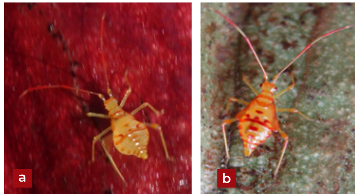
Figura 2. Ninfas de la chinche del cacao Monalonia cf. annulipes Signoret.

M. mymaripenne Timberlake (Hymenoptera: Trichogrammatidae), depredadores: Orius thripoborus (Hemiptera: Anthocoridae), Franklinothrips tenuicornis Hodd, F. vespiformis Crwf. (Thysanoptera: Aelothripidae), Paracarnus sp., Teratophylidea maculosa Usinger, T. pilosa Reut., T. opaca Calvalho, T. ocellata Calvalho (Hemiptera: Miridae), Ninyas torvus Dist. (Hemiptera: Lygaeidae), Triphlep sp. (Hemiptera: Anthocoridae), Wasmannia auropunctata Roger (Hymenoptera: Formicidae), Beauveria globulifera (Speg.) y Cephalosporium sp. (Entomopatógenos) (Entwistle 1972; Martínez-González et al. 2006; Vélez-Ángel 1997).