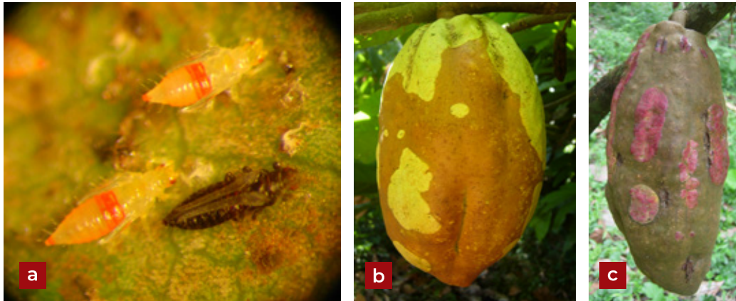
Figura 1. Trips bandirrojas del cacao Selenothrips rubrocinctus (Giard.): a) Ninfas y adulto; b, c) Daño en frutos de cacao.

o blanquecino plateado, y finalmente marrón, a medida que el tejido muere; si el ataque es fuerte, se presenta el fenómeno de “quema”, que consiste en que las hojas caen y la planta presenta defoliación parcial o total. Cuando los adultos y las ninfas atacan los frutos de cacao, la savia que aflora a través de los orificios de alimentación, se derrama sobre la cutícula y se oxida, tomando un color castaño y bronceado, con aspecto ferruginoso que dificulta la diferenciación entre frutos maduros y atacados por el insecto, lo que puede atrasar la cosecha y reduce la calidad del cacao, debido a la falta de fermentación, deteriorando el producto final, pues las semillas están sobremaduras en estado de germinación. Si el daño es en frutos jóvenes, se perjudica el desarrollo y en frutos más pequeños causa la sequedad y muerte (Coto y Saunders 2004; Vélez-Ángel 1997). Los ataques severos pueden producir la caída prematura de las hojas dañadas, especialmente durante los periodos secos y en plantaciones con poca sombra, donde las poblaciones del insecto son más abundantes. El estrés de los árboles por nutrientes o suelos empantanados en las plantaciones podrían favorecer la reproducción rápida del insecto (Coto y Saunders 2004). En la selva del Perú causa la defoliación y deterioro del fruto en plantaciones de cacao que carecen de sombra adecuada, acentuándose el problema durante periodos