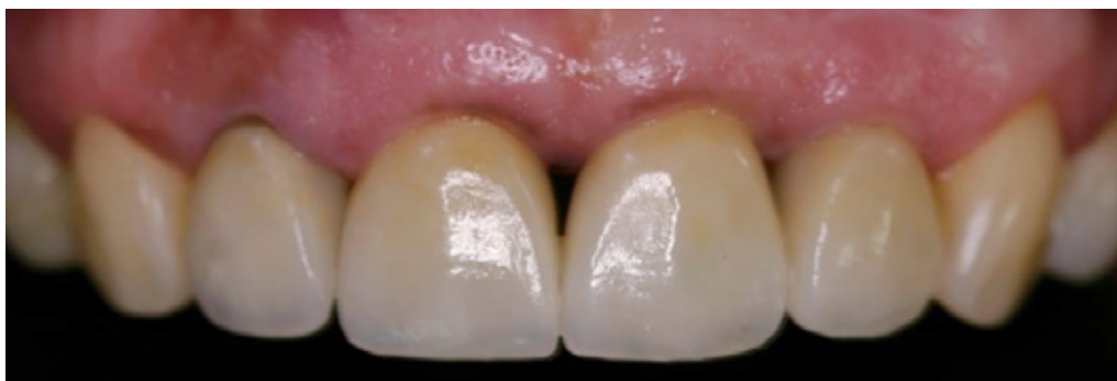
Figura 5. Control a las 24 horas.