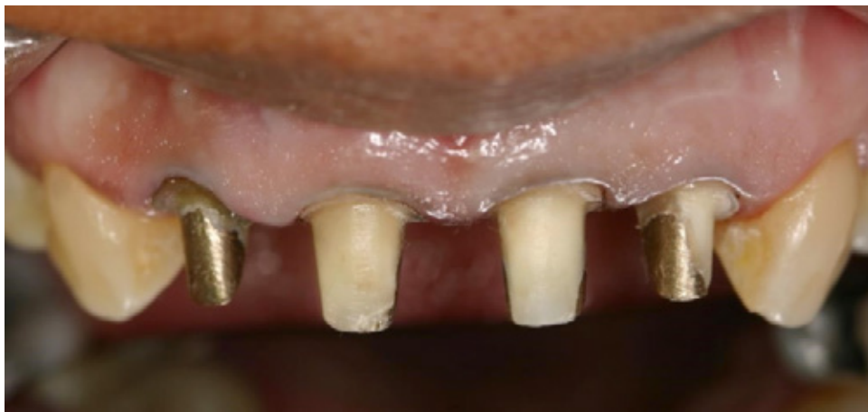
Figura 2. Postes procesados en cromo amarillo cementados

Una vez finalizados los patrones se enviaron al laboratorio para ser procesados en cromo amarillo con la finalidad de facilitar su enmascaramiento al colocar una corona libre de metal, después de ser probados y adaptados fueron cementados con Luting 2 de la marca 3M, cementado según el protocolo del fabricante 10 (Figura 2). Se tomó radiografía control de la cementación. Para la selección del color se utilizó la guía VITA donde se estableció un color base A2 con colores tenues A3 en la región cervical y A1 acompañado de traducidos en el borde incisal.