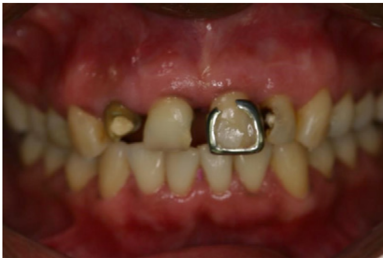
Figura 1. Fotografía inicial.

Los incisivos se encontraban asintomáticos, se evidenció la pérdida dental con diferentes grados en la estructura coronal remanente, los dientes 1-2, 1-1 y 2-2 presentan cemento provisional, mientras el 2-1 una corona fenestrada, presencia de diastemas en todo el sector antero superior. Se observan líneas medias dentales no coincidentes con la línea mediafacial, línea de sonrisa baja. A la evaluación de la articulación temporomandibular se encontró asintomática y la musculatura normotónica (Figura 1).