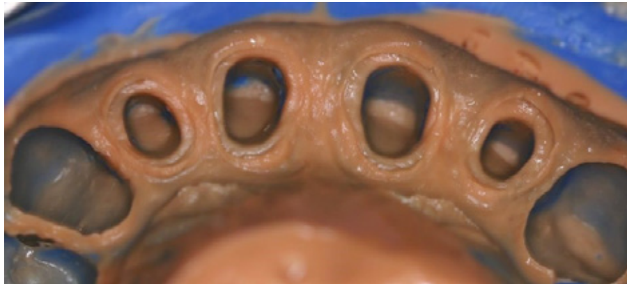
Figura 3. Impresión definitiva

El modelo de trabajo fue vaciado con yeso tipo IV, individualizado y debridado. A continuación, se realizó el remontaje en el articulador con el modelo de trabajo, se envió al laboratorio para ser escaneado y diseñado por el ordenador, mecanizado, presinterizado y procesado de las coronas de Disilicato de litio con técnica cut-back (Figura 4).