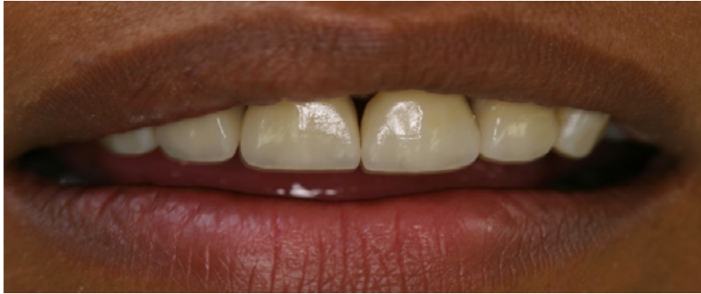
Figura 6. Control a los 30 días.